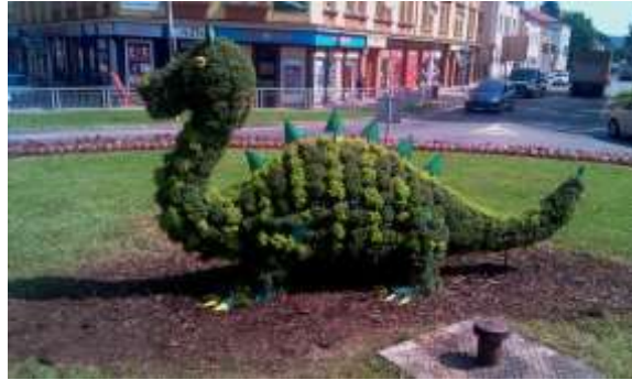
collection of Integral part o found the

Trutnov features one unique – it holds legends linked to establishment of the town. fit is the legend on Trutnov's dragon . You can fabulous creature in many places of Trutnov.