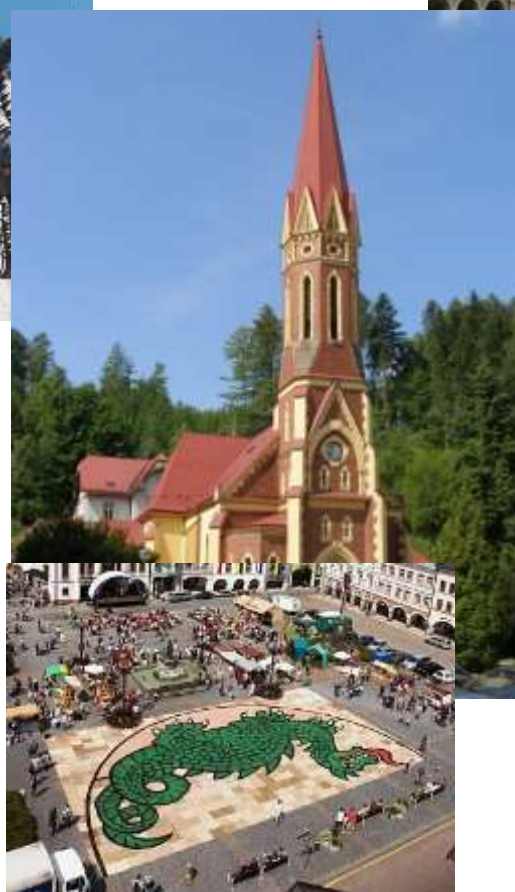
Church of Blessed Concert Hall