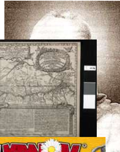
was the map of

Trutnov is the birthplace of Samuel Fritz (1654-1730), Jesuit missionary who first to produce an accurate the Amazon River in 1707.