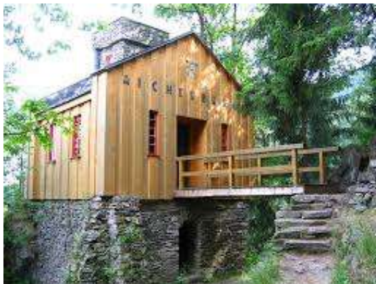
Horní Maršov Aichelburg