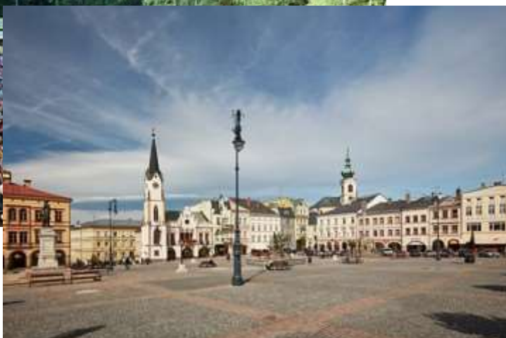
of the Old