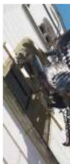
The Bohuslav Martinů