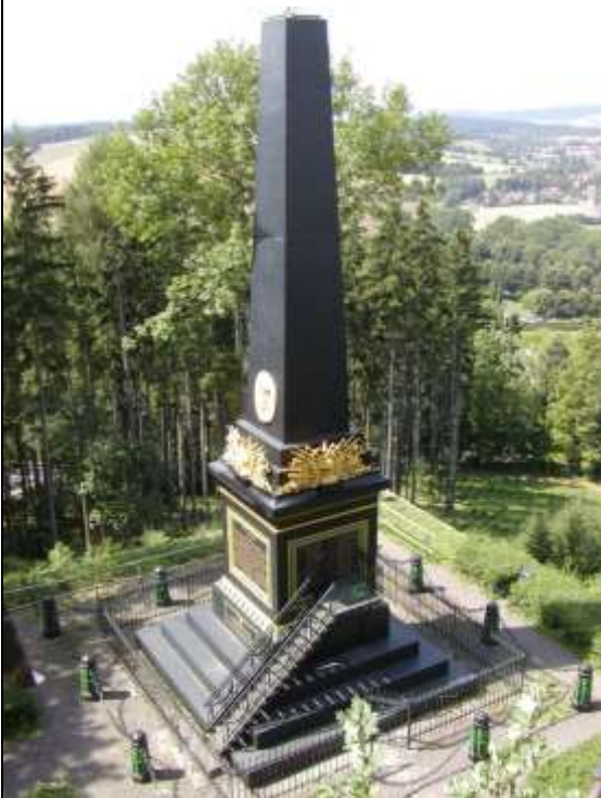
The Monument of General Gablenz

Uffo Society Centre – Building of Year 2011 of Hradec Králové County, TOP INVEST 2011 Award