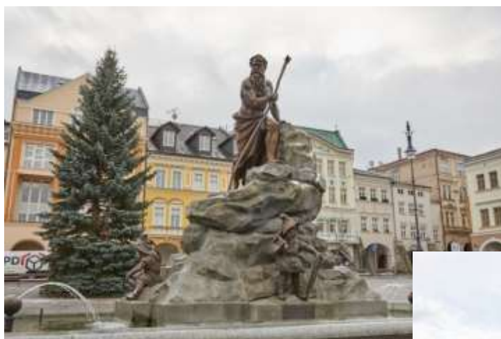
The Old Town