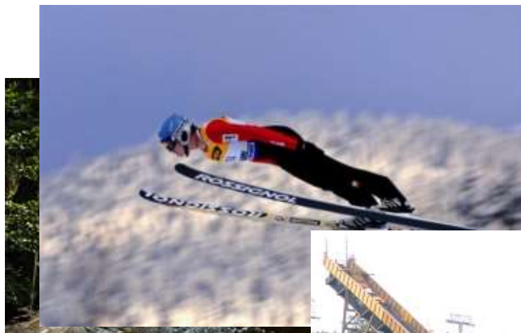
Ski jumping hill